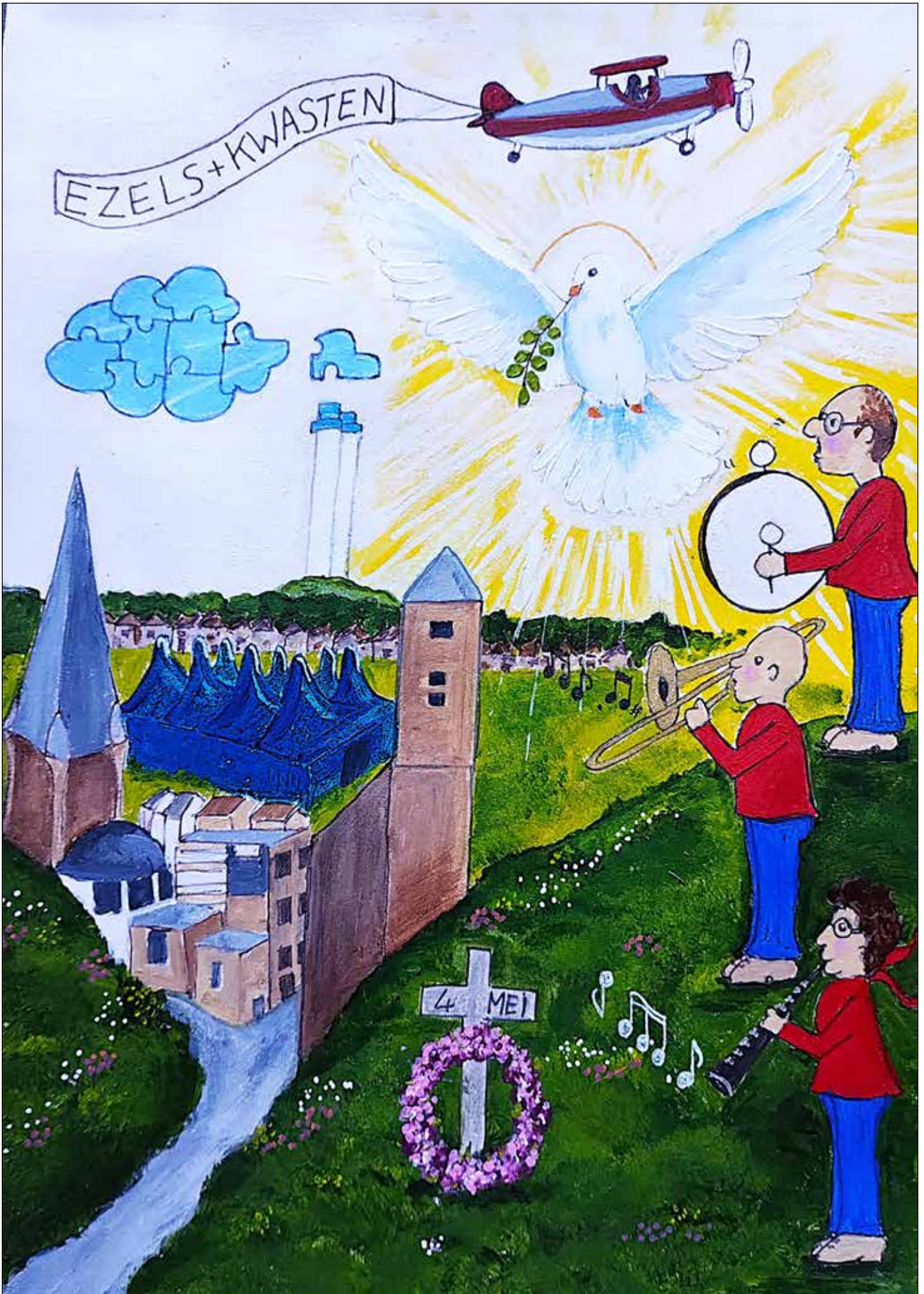
Illustratie: Sonja Smit.