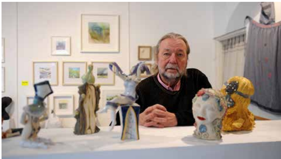
Vrijwilliger bij de Kop van WaZ en De TIP.

De inmiddels gefuseerde scholen in Wijk aan Zee vallen tegenwoordig onder het bestuur van de 'Stichting Fedra' in Beverwijk.