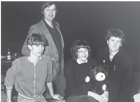
1981 Theaterworkshop Velsen. Cast van 'De Collectie' van Harold Pinter.